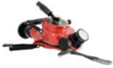
APF 2-Turbofighter Standard