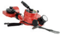
APF 2-Turbofighter oszillierend